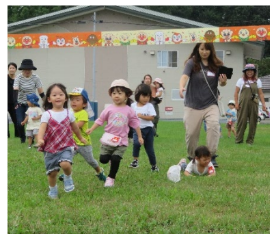
今年のぱちぱち運動会の様子

本園のぱちぱちルームは、広い園庭を活用したり、自園のバスに乗って遠足に行くなどの郊外活動を数多く取り入れているのが特徴です。来年の春には、多くのお友だちに会えるのを楽しみにしています。