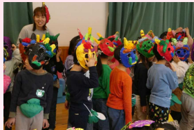
年長さんは力強い鬼