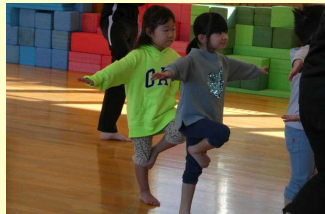
年少さんの「かかし」