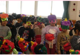
年中さんはかっこいい鬼