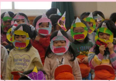
年少さんはかわいい鬼

2月3日(月)に節分豆まきを行いました。節分のお話を聞いて、紙芝居を見たり、「おにはうちでひきうけた」を元気いっぱい歌ったりしていると、「赤鬼・青鬼」が金棒を持ってやってきました。そこで、みんなで協力して豆まき!年長さんが赤鬼・青鬼から金棒を取り上げて鬼退治成功!! 「泣き虫鬼」「おこりんぼ鬼」「くいしんぼ鬼」「なまけ鬼」「好き嫌い鬼」など、もしかすると子どもたちや大人の心の中にもいるかもしれないたくさん鬼を退治しました。