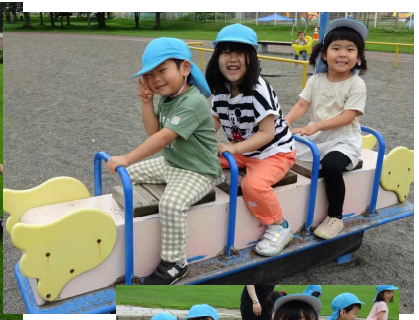
広々とした公園で、身体を思いっきり動かして遊びました！