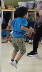
平均台では両手を広げてバランスをとりながら、片足ずつつますぐ前進！ 縄跳びは、タイミングをとりながら10回跳びを目指して頑張っています！