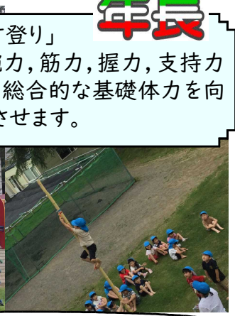
今日の目標は・・・「鈴を鳴らす(頂点)まで！」と自己申告。 仲間の応援を励みに頑張っています！