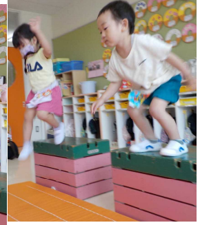
両足を揃えてのジャンプや着地は、意外に難しい！ 3段・4段と難易度を上げて挑戦しています！