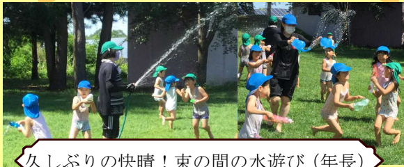
久しぶりの快晴！東の間の水遊び（年長）