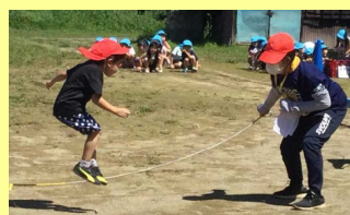
もうすぐ運動会 ただいま猛練習中！