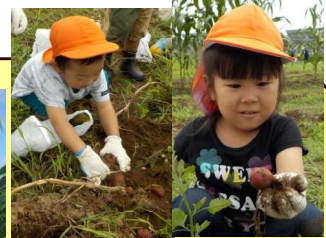
じゃがいもとれたよ！（年少）