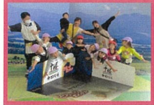
トリックアート写真館 みんなで空をとんでます！

年中つき組さんが明治乳業に工場見学に行ってきました。当初はたいよう組さんも予定していましたが、体調不良のお子さんが多く、つき組さんのみの見学となりました。