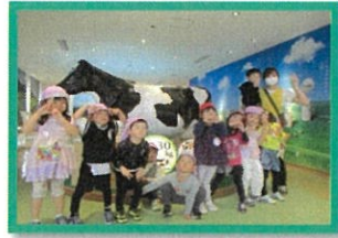
牛さんと集合写真パチリ📷