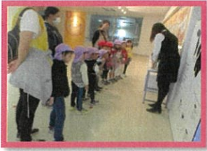
お姉さんのお話をしっかり聞いていましたよ