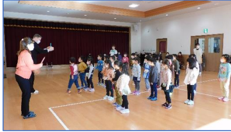
【きりん組英語参観の様子】