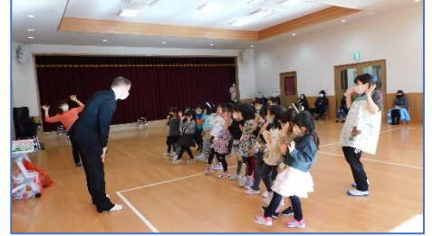
【ぞう組英語参観の様子】